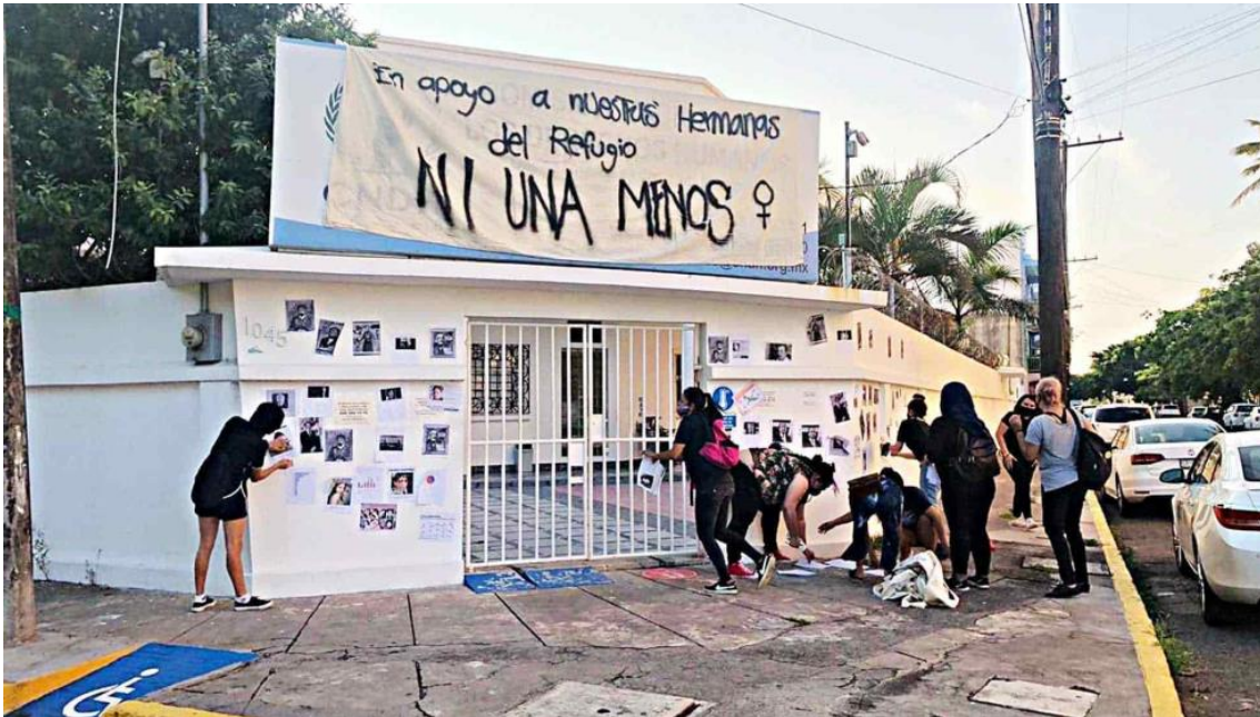
(Oficinas de la CNDH intervenidas en Veracruz)