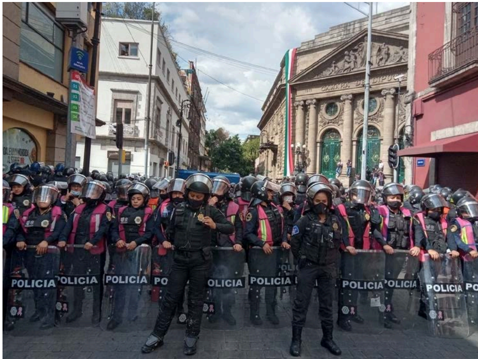
(Escuadrón Atenea en el encapsulamiento el 27 de septiembre)