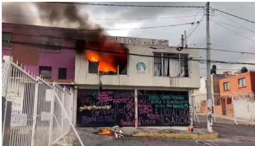
(Instalación de la CODHEM mientras se incendiaba)

Este hecho alentó a más mujeres a que accionaran contra otras instalaciones de la CNDH en otros estados. Una de ellas fue la toma de la sede de la Comisión de Derechos Humanos del Estado de México (CODHEM) en Ecatepec el 10 de septiembre, buscando repetir la acción llegaron a irrumpir a las instalaciones, sin embargo, en la madrugada del día siguiente llegó la policía a sacarlas del espacio de forma violenta y en vehículos no oficiales, llevándoselas detenidas 4 . Ante estos hechos, la Okupa Ni una Menos se pronunció repudiando la actuación del gobierno, por otra parte, algunas individualidades decidieron ir a las instalaciones ese mismo día para vandalizarla y terminar quemándola.