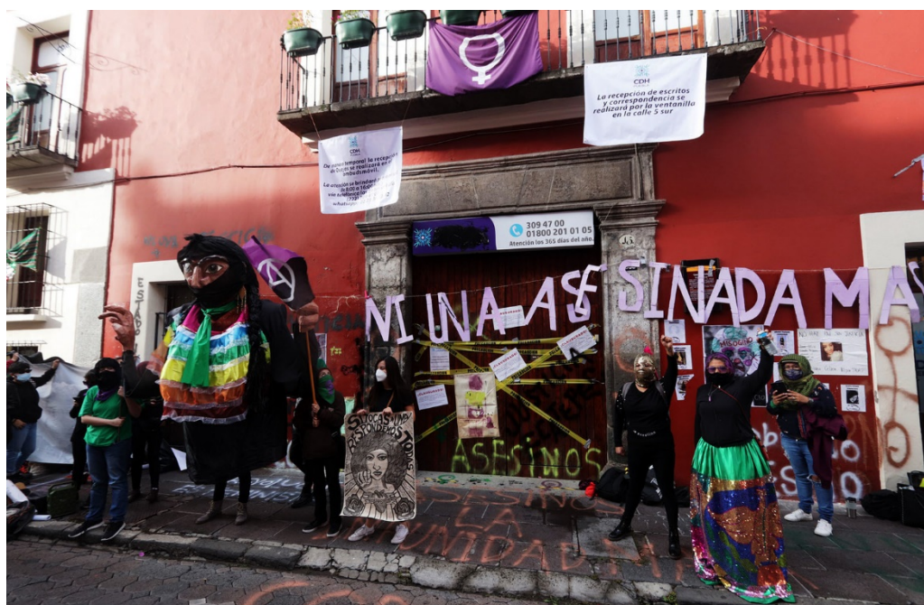
(Toma de las instalaciones de la CNDH Puebla)