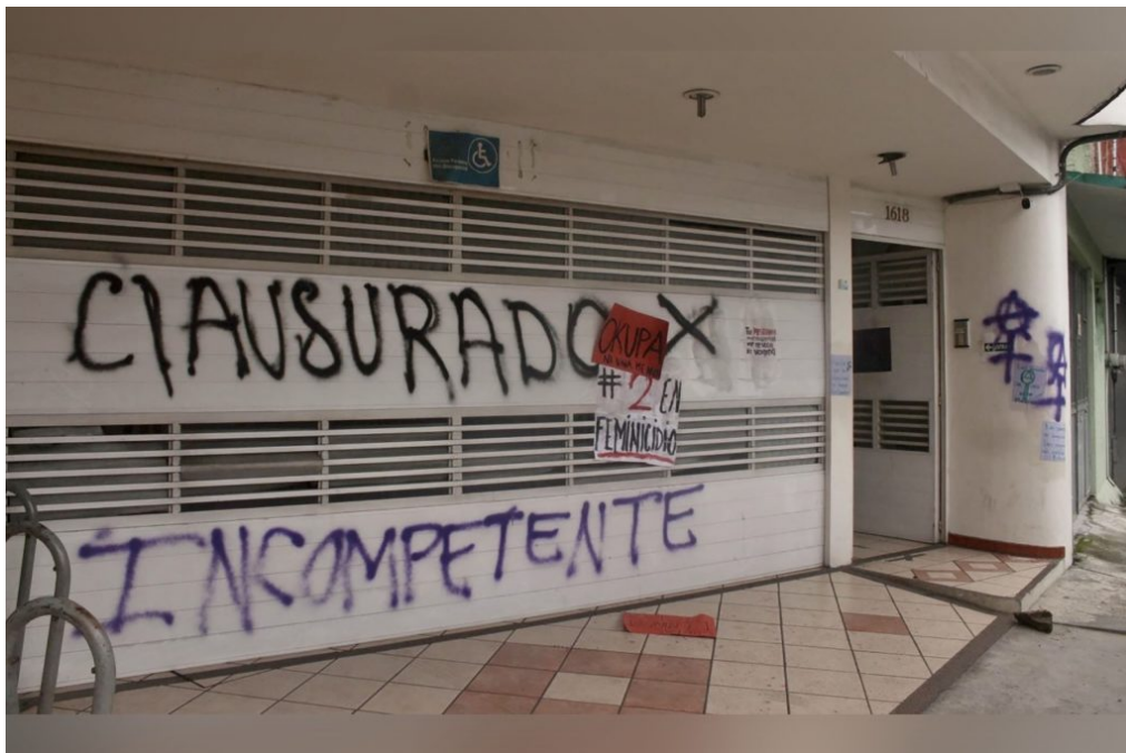
(Fachada del Instituto Veracruzano de las Mujeres vandalizado en Xalapa)