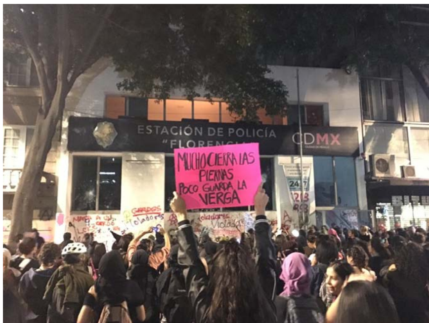
(Fachada de la estación de policía durante la protesta)

Bajo este contexto, es que ahora vemos una vinculación bastante estrecha entre anarquismos y feminismos, no podemos determinar que posturas, colectivos o individualidades se deben de reconocer como anarcofeministas, pues se encuentran en un proceso de consolidación y reformulación constante. El 16 de agosto de 2019 en la Ciudad de México se convocó a una movilización por parte de diferentes grupos, colectivos y colectivas para pedir justicia por una joven que fue violada por policías, la cual terminó con una insurrección de mujeres que vandalizó inmobiliario público y con la quema de una estación de policía.